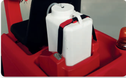
Dosatore detergente on board On board detergent dosing system Dosificación detergente a bordo