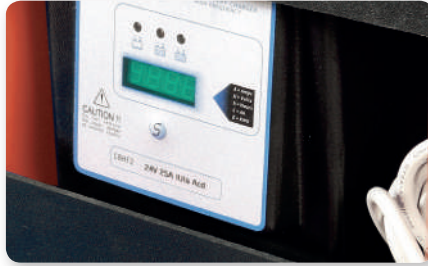
Carica batterie on board On-board battery charging Cargador de batería incorporado