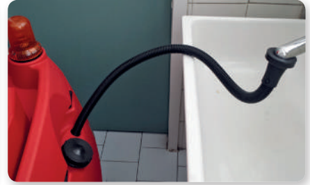
Tubo riempimento serbatoio Solutions filling hose Manguera llenado deposito